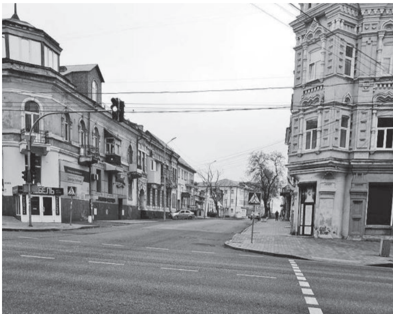
Мирний Маріуполь, 25 листопада 2021 р.

...А в мене в пам'яті – Маріуполь кінця листопада минулого року. Група українських журналістів перебувала там з обмінним візитом «Огляд кращих практик співпраці влади, громадськості та бізнесу в Запорізькій, Луганській та Донецькій областях». Головним організатором була Програма ООН