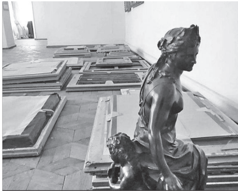
Так виглядає сьогодні приміщення Харківського художнього музею.

У фондах музею налічується біля 10 тисяч музейних предметів. Тут постійно працювали три експозиції та виставкова зала. Експурсанти приходили ознайомитися з «Фа-