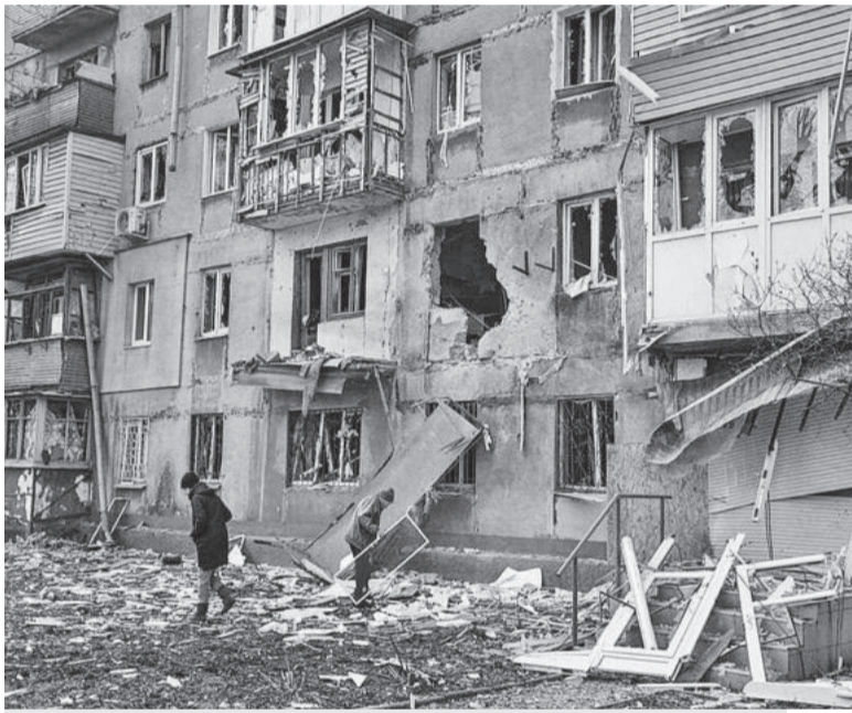
Перші дні. Обстріли тільки почалися.

із відновлення та розбудови миру (напрямок – «Громадська безпека та соціальна згуртованість»), партнерами виступали Міністерство з питань реінтеграції тимчасово окупованих територій, місцеві органи влади та громадські організації, що співпрацюють з ПРООН за цим напрямом.