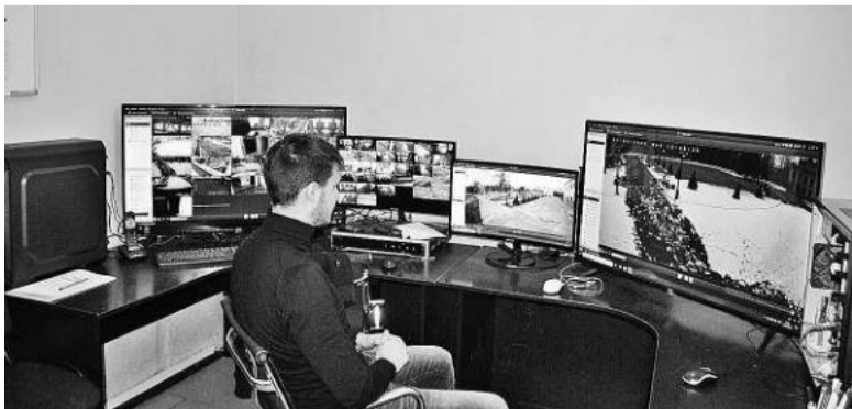
На території КПІ встановлено близько ста камер відеоспостереження. На центральному пульті – цілодобове чергування.