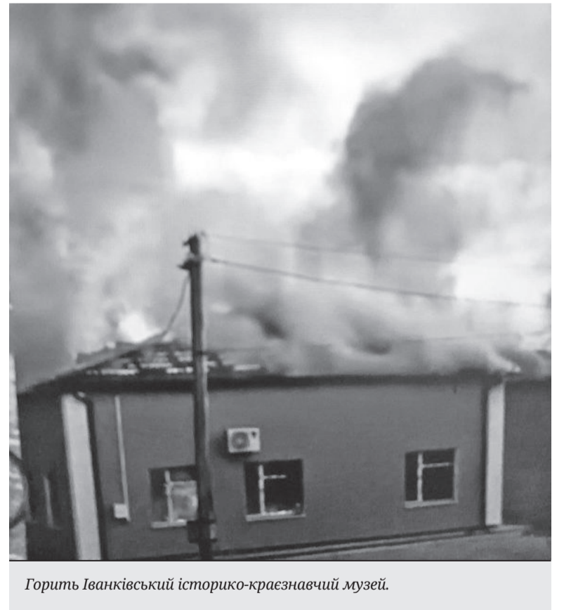
Горить Іванківський історико-краєзнавчий музей.

Міністерство культури та інформаційної політики України створило ресурс для документування воєнних злочинів проти людяності та об'єктів культурної спадщини, скоєних армією РФ – https://culturecrimes.mkip.gov.ua . На цей ресурс просять надсилати фото пошкоджених старовинних будівель (пам'яток архітектури), історичних кладовищ, пам'ятників, релігійних споруд, творів мистецтва, пам'яток природи, будівель закладів культури – театрів, музеїв, бібліотек. А також фото руйнування археологічних об'єктів – курганів, валів давніх земляних укріплень, місць розкопок тощо, розповідати про факти захоплення майна, пограбування музеїв, бібліотек та інших закладів культури. Ці матеріали будуть використані у Міжнародному кримінальному суді в Гаазі.