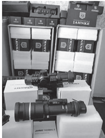
Співробітники ДКТБ Інституту електрозварювання ім. Є.О.Патона постачають українському війську високотехнологічні оптичні прилади