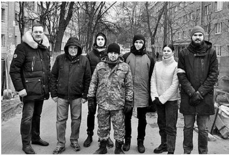
На блокпостах несуть варту і студенти. Керівництво КПІ співпрацює з теробороною.

Нещодавно господарські служби запустили в експлуатацію бюветний комплекс. Навіть якщо від-