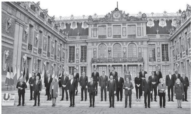
Саміт Європейської ради схвалив декларацію щодо перспективи членства України в ЄС

У заяві президента МГС, професора Майкла Медоуза наголошується, що Російський національний комітет невід'ємно асоціюється з Російським географічним товариством. Президентом цього товариства є міністр оборони Російської Федерації Сергій Шойгу, а опікунську раду очолює Володимир Путін.