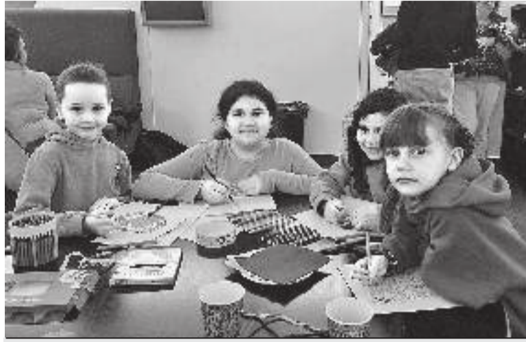
Поки батьки навчаються, діти – малюють.

Перекладач з української на шведську ледве встигала озвучува-