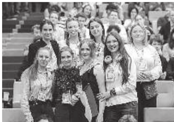
Команда дівчат-учасниць турніру фізиків.

Як розповів газеті «Харківський університет» Олексій Голубов, учасники збиралися у Львові. Але 4 травня російські ракети завдали ударів по критичних об'єктах інфраструктури заходу країни, і потяги запізнювались... 5 травня команда рушила автобусом до Варшави, потім літаком через Мадрид і Боготу в колумбійське місто Букараманга.