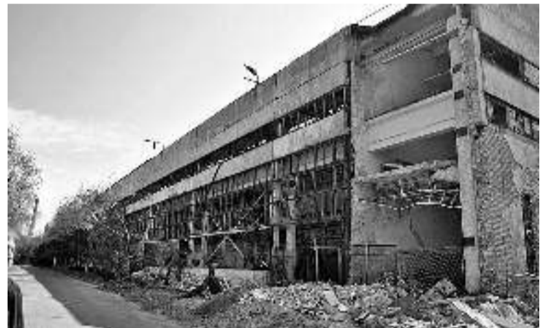
Корпуси інституту після обстрілу.