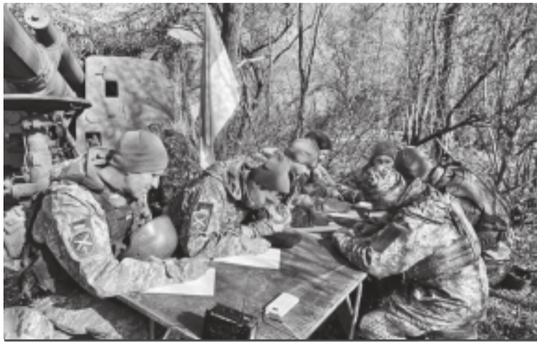
Воїни на передовій пишуть диктант Національної єдності

Але як ми дізнаємося про особливості дописемного мовлення? Виявляється, з помилок, які пізніше робили переписувачі богослужбових книжок. Вони передавали граматичними формами звучання, до якого звикли. Робили це мимоволі, створюючи тим самим важливе джерело інформації про тодішню живу мову, підкреслив Богдан Ажнюк. Наприклад, уже в XI–XII ст., а то й раніше, кияни, переяславці, чернігівці вимовляли (визначальне й для сучасних українців) гортанне Г (голова, город, господар), а не вибухове Г. Вживали в давальному відмінку іменників чоловічого роду закінчення -ОВІ, -ЕВІ, а також кличний відмінок, форми дієслів теперішнього часу з м'яким