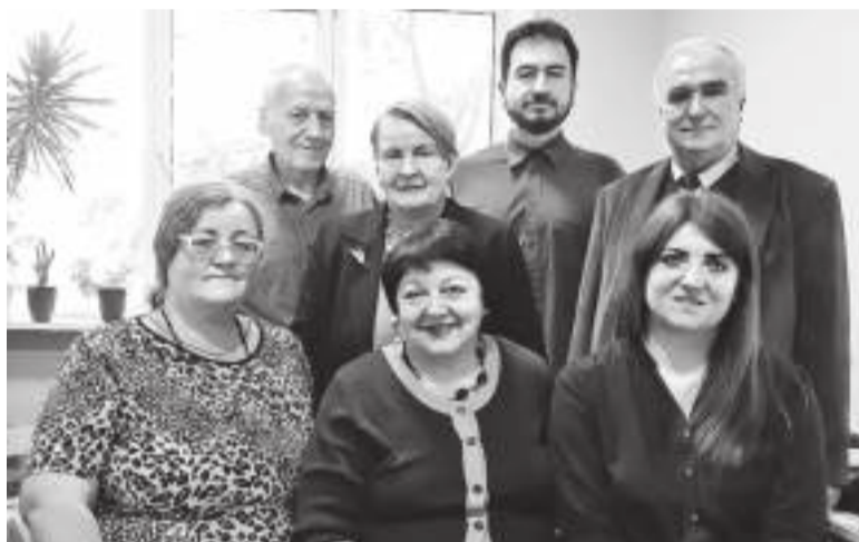
Команда, яка працювала над створенням нової біотехнології

гризунів: мишей (у віварії інституту) та щурів (з ними працювали науковці КНУ імені Тараса Шевченка). «Перевірили, як діють наші препарати й методики на опіках третього ступеня. Найбільш ефективними виявилися мезенхімальні стовбурові клітини, які пришивали загоєння на ранніх, найбільш критичних стадіях», — зазначила доповідачка.