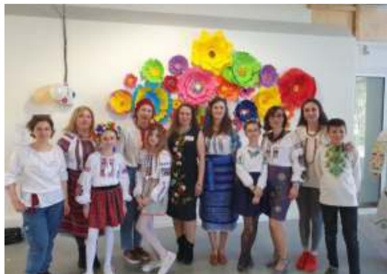
Українки у Швеції в День вишиванки