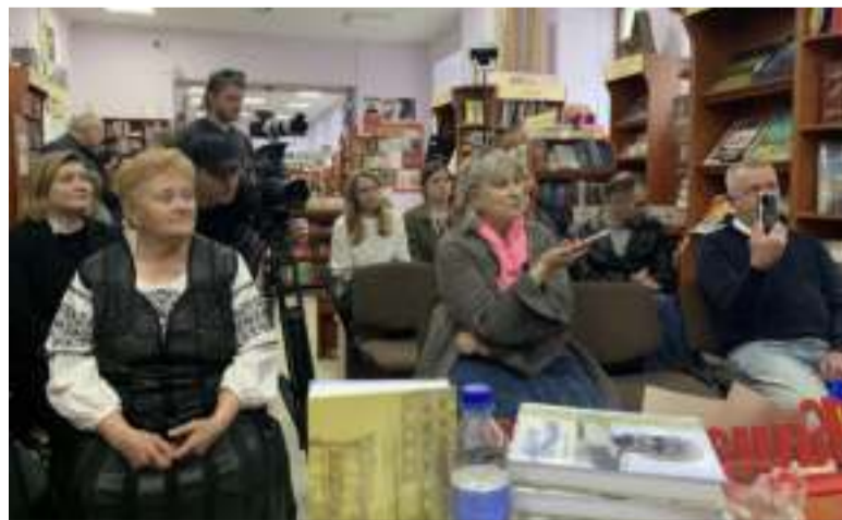
Презентація «Поетичних акордів» у тернопільській книгарні «Є»

Покарання вона відбувала у Тайшеті Іркутської області — в таборах «Озерлагу». Поки її колежанки в Києві відвідували лекції та бібліотеки, ходили на побачення й кон-