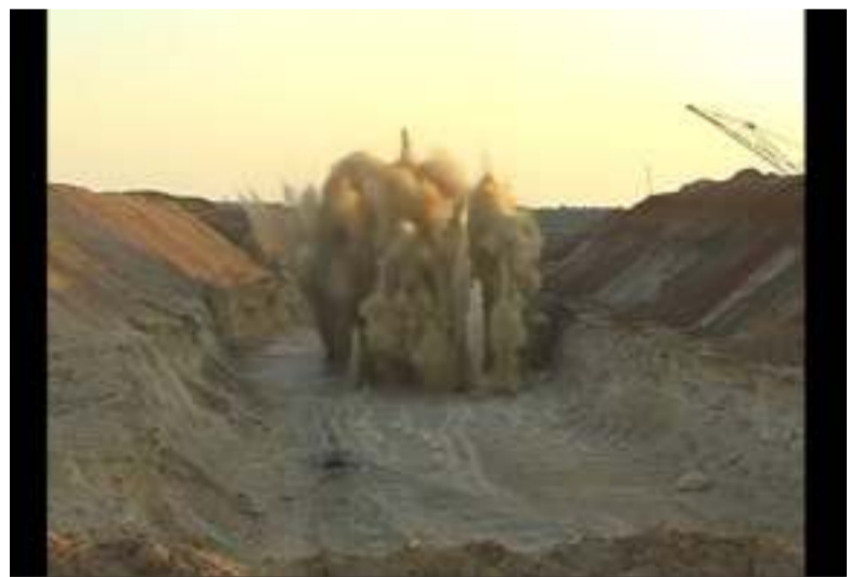
Працює вибухівка з переробленого палива

15 млн 109 тис. грн ДП «Виробниче об'єднання Південний машинобудівний завод ім. О. М. Макарова» — для забезпечення зберігання гептилу (рідкого ракетного палива), а також 133 млн 452 тис. грн ДП «НВО «Павлоградський хімічний завод» — для утилізації твердого ракетного палива.