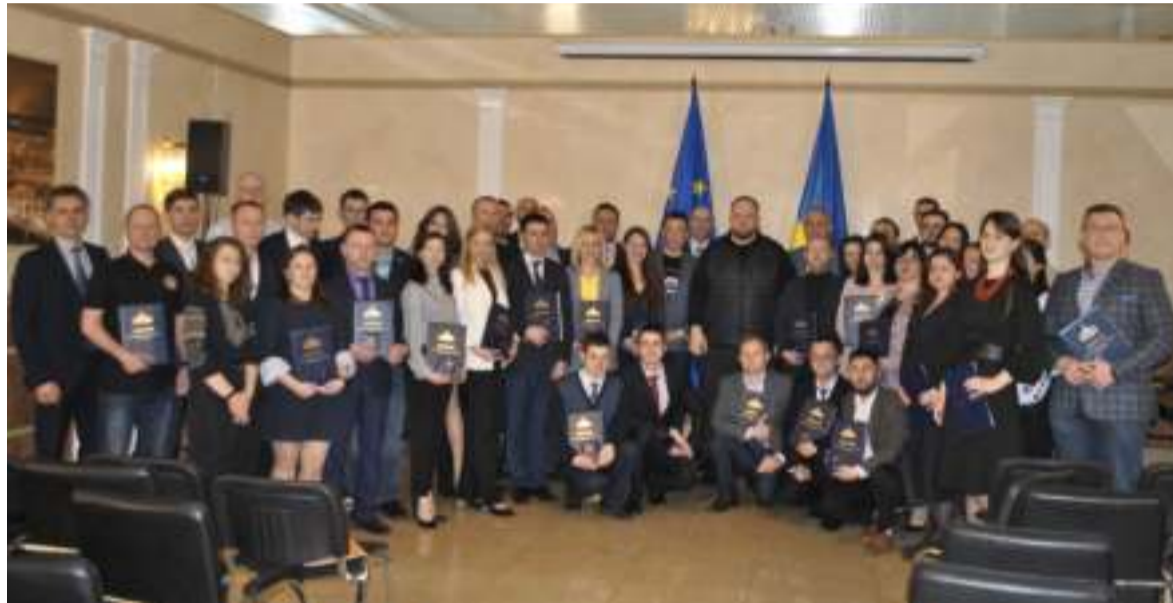
Під час вручення нагород.

На це запитання Голова ВР відповів, що «освітня базар», коли 200 закладів готують юристів і 200