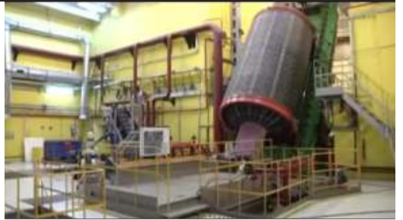
На фото: Вилучення палива з другого ступеня ракети

Але вже навесні того ж року кошти були виділені й утилізація продовжилася. Кабінет Міністрів виділив з резервного фонду